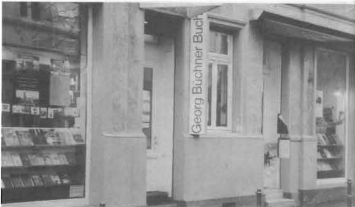
Buchhandlung Georg Büchner (Nr.18)