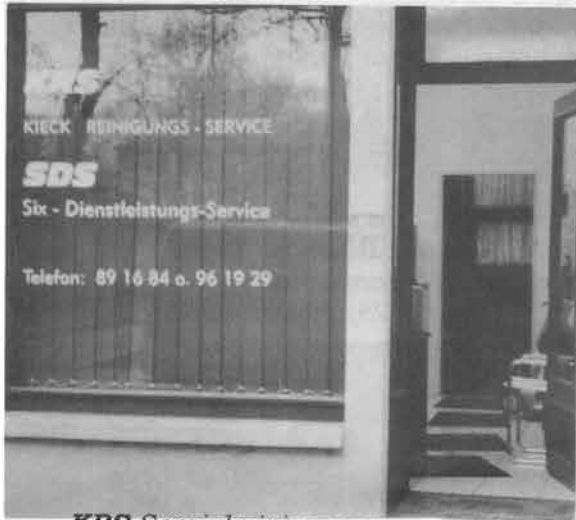
KRS Spezialreinigungen Glas- & Gebäudeservice (Nr. 7)