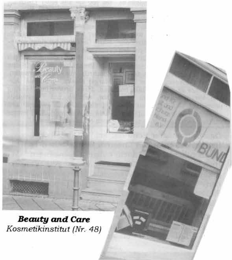
Beauty and Care Kosmetikinstitut (Nr. 48)