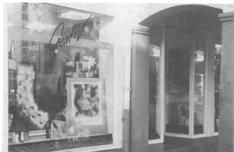
Schöne Frisuren bei Friseur-Team Creativ , Lauteschlägerstr. 1A