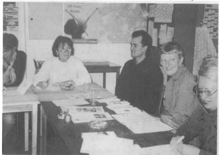
Bündnis 90/Die Grünen Büro, Tagungsraum, Geschäftsstelle (Nr.38)