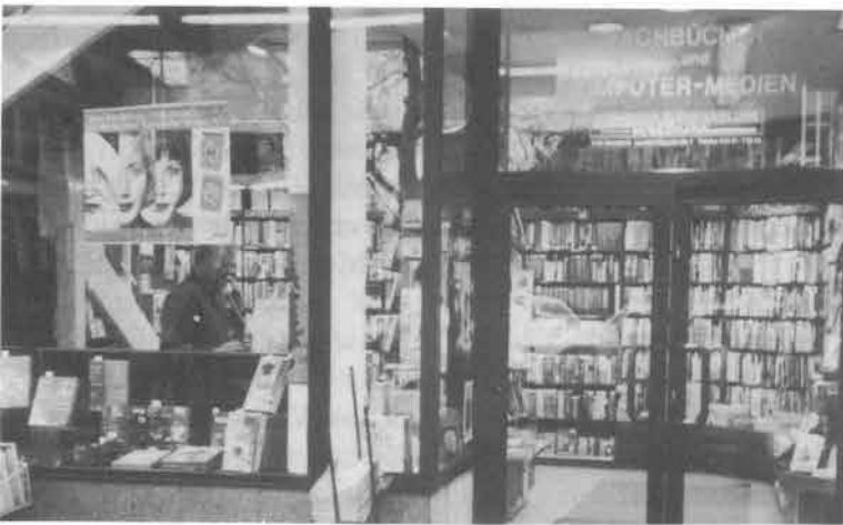
Alles für Studentinnen und Studenten: Hochschulbuchhandlung Wellnitz , Lauteschlägerstr./Ecke Kantplatz

heutige Lauteschlägerstraße, benannt seit 1873 nach dem Baumeister Carl Christian Lauteschläger, der auch einer der Initiatoren für die 1864 erfolgte Gründung des Bauvereins für Arbeiterwohnungen (heute: Bauverein) war, wurde vor den neugebauten Häusern angelegt.