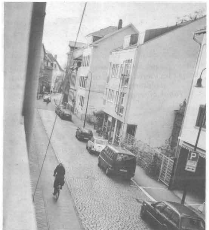
Lauteschlägerstraße von der Heinheimer Straße in Richtung Hochschule gesehen.