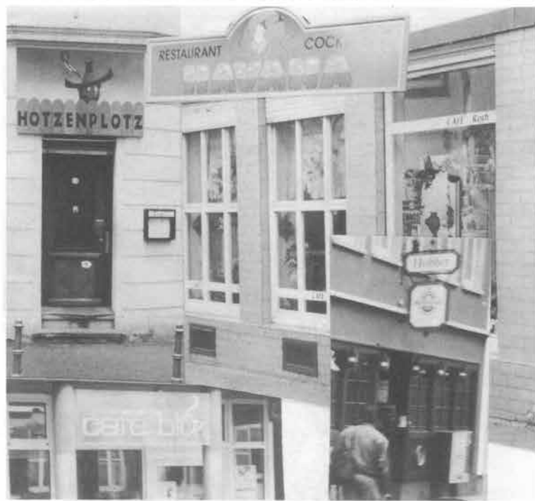
Kneipen und Cafés in der Straße: Hobbit (Nr. 3), Café Roth mit Bäckerei Laun (Nr. 8), Zum Hotzenplotz (Mauer-/Ecke Lauteschlägerstr.) Café blu (Nr.28), Hawanna (Nr. 42)