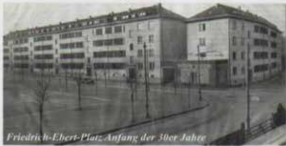
Friedrich-Ebert-Platz, Anfang der 30er Jahre

Bad Nauheimer Straße 1 64289 Darmstadt Tel.: 06151-97199-45 Fax.: 06151-97199-46