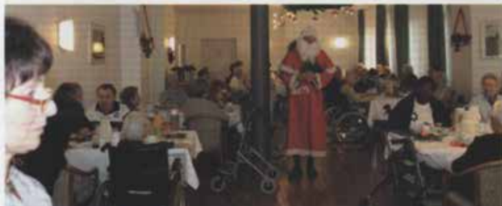
Am 5. Dezember kommt der Nikolaus ins Martinsviertel-Altenheim Emilstraße. „Niklaus, mach dich auf die Reise, in die Emilstraß' mit leckerer Speise, ...“