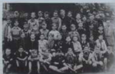
Eine Dokumentation der Klasse 8K Schillerschule Darmstadt Schülerzeitung Ostern 1954

Kriegskinder dokumentieren ihre Schulzeit