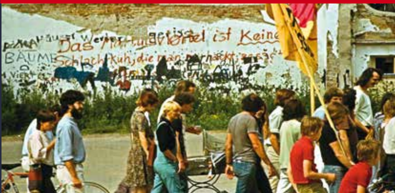
Osttangentedemo 1979

Damals die Osttangente, heute der Bürgerpark