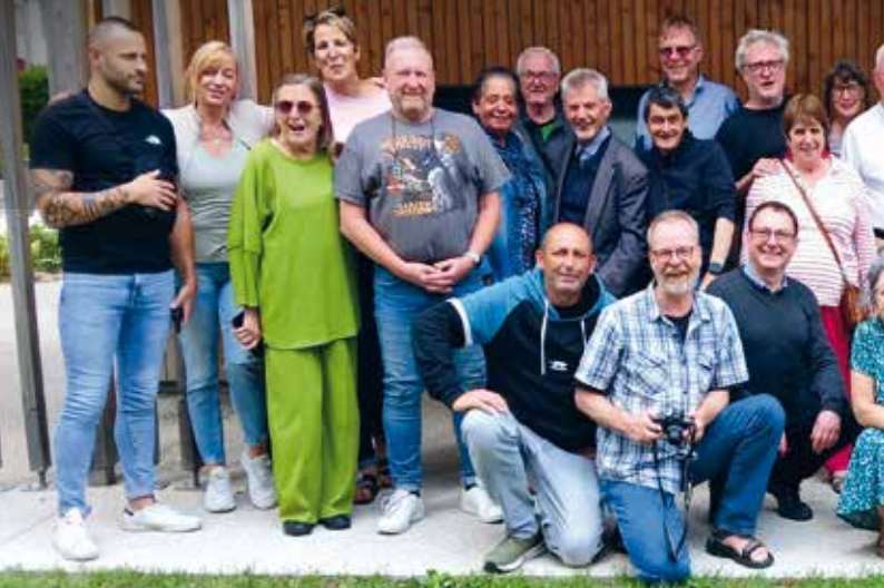
Jumelage-Treffen 2025 in Troyes

Am Pfingstwochenende erwarten wir von Freitag, 22. Mai, bis Sonntag, 24. Mai, unsere Freunde aus Troyes zum Jumelage-Jubiläum im Darmstädter Martinsviertel. Die erste und älteste europäische Partnerschaft auf Stadtteilebene zwischen dem Darmstädter Martinsviertel und dem Quartier Saint Martin de Troyes besteht dieses Jahr seit 50 Jahren!