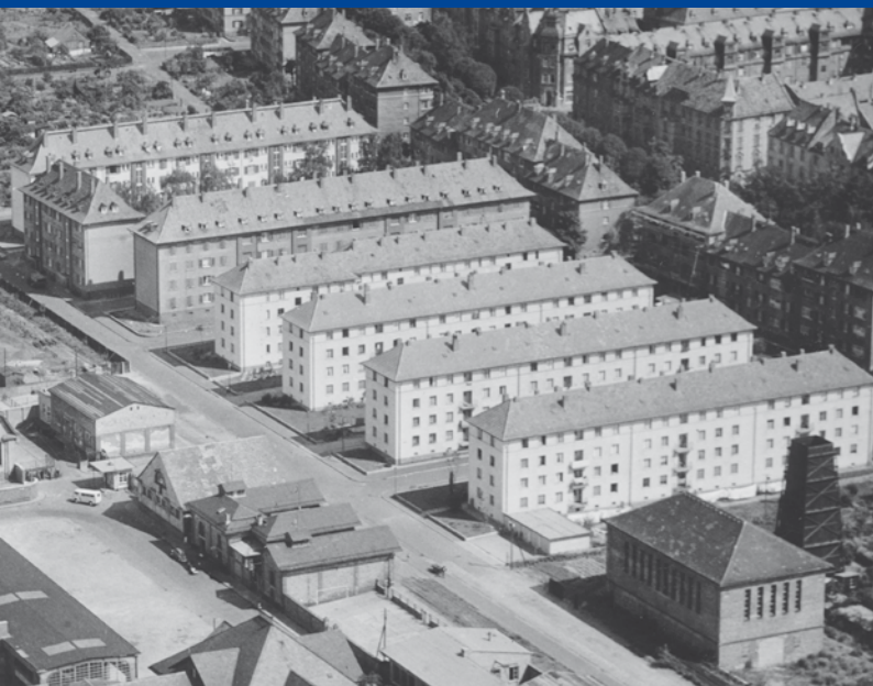
Die Büdinger Straße Mitte der 1950er-Jahre

Die Straße existiert seit 1892/93. Sie entstand mit dem Bau des damaligen Darmstädter Schlachthofes und trug den Namen Schlachthausstraße.